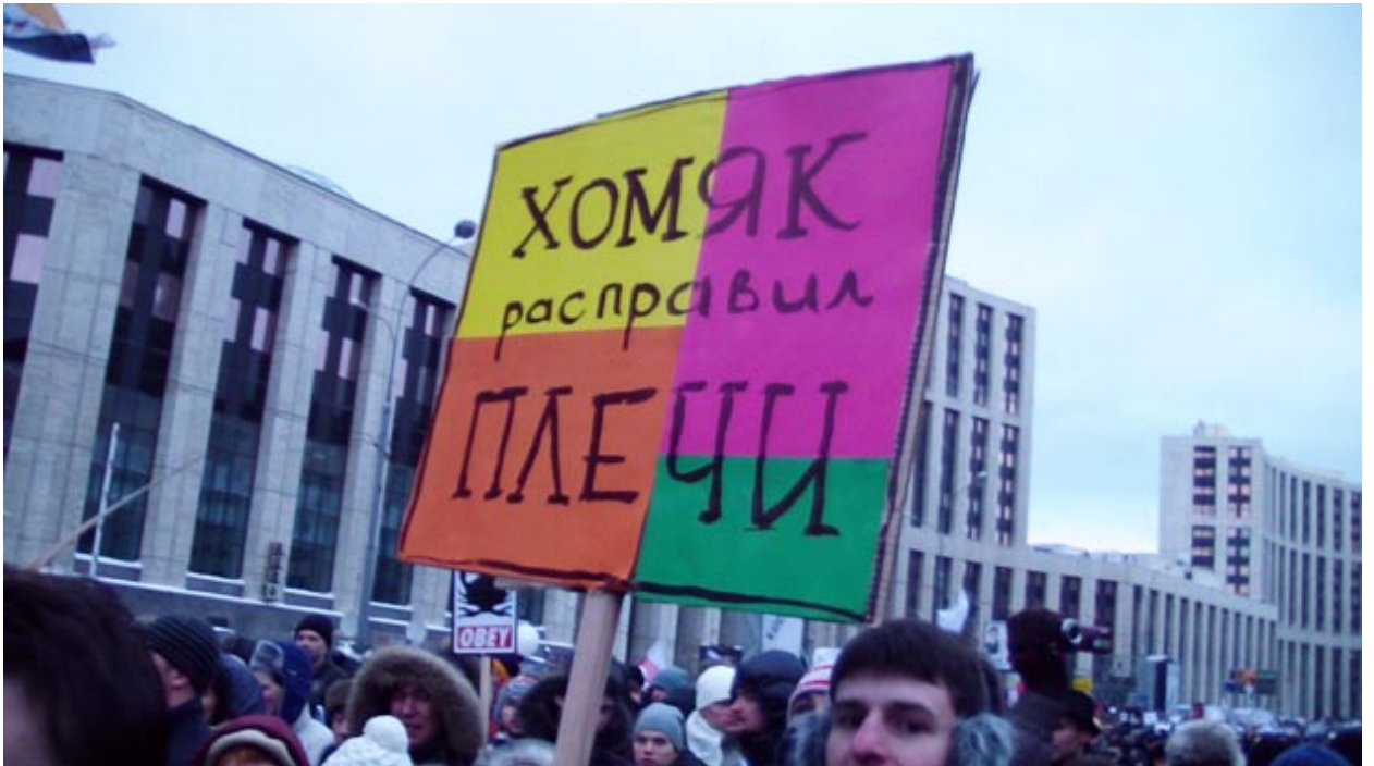
Dòng chữ Nga: “Con chuột đã vươn vai”.