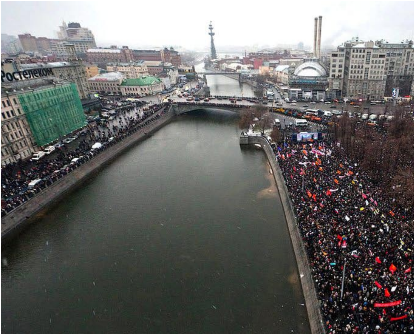
Cuộc biểu tình trên quảng trường Bolotnaya ngày 07.12.2011.

Để biểu lộ tinh thần ôn hòa, trong sáng của mình, những người biểu tình đeo dải băng vải trắng ở ngực. Họ mang theo nhiều biểu ngữ, vạch trần sự gian dối của kẻ cầm quyền và tình trạng mất dân chủ của chế độ. Cũng có không ít biểu ngữ trực tiếp đả kích ông Putin.