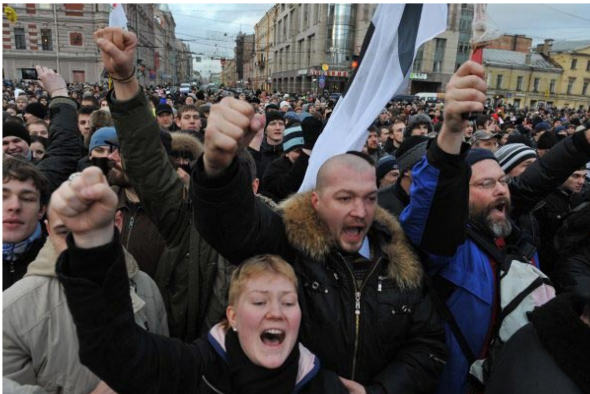
Dân Moskva biểu tình phản đối bầu cử gian lận.

óc suy nghĩ. Đây là động lực chính thúc đẩy xã hội dân sự tiến lên mà mọi sự đàn áp bằng bạo lực sẽ trở thành vô hiệu.