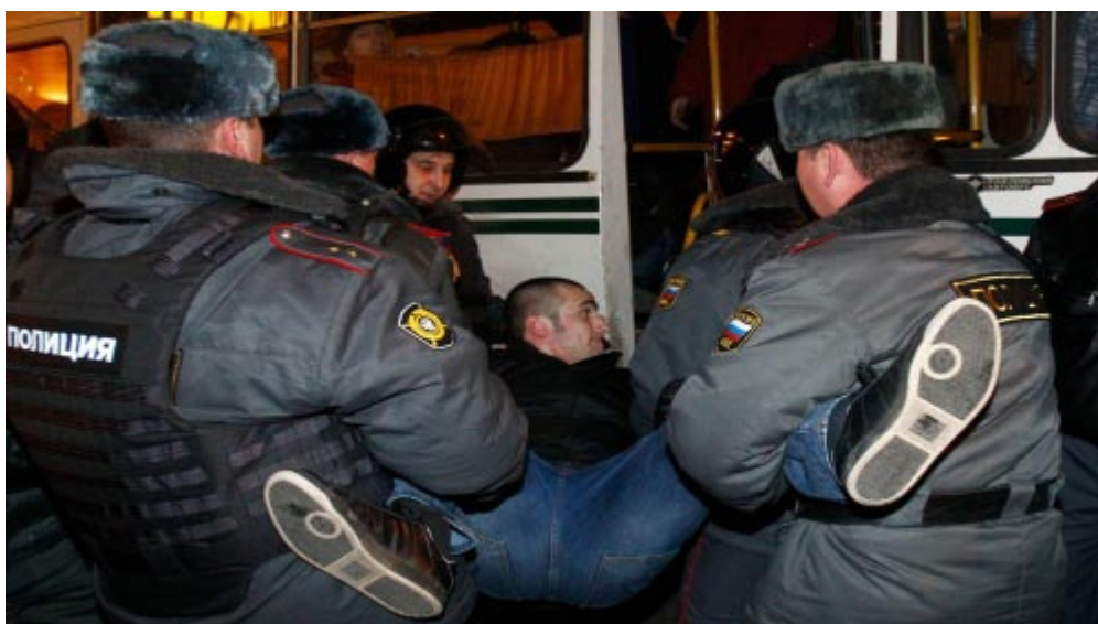
Cảnh sát bắt blogger Alexei Navalny trong một cuộc biểu tình.

2/ Nhân dân Nga đang từ trạng thái mê ngủ đã tỉnh dậy, đứng lên và cất cao tiếng nói của mình. Ý thức chính trị của họ ngày càng phát triển và quyết tâm của họ đòi hỏi tự do, dân chủ và nhân quyền càng ngày càng mạnh mẽ hơn. Các lực lượng đối lập với chính quyền sẽ cố sức tập hợp và phát triển rộng hơn, và điều đáng ghi nhận là từ trong phong trào đã xuất hiện những người lãnh đạo trẻ xuất sắc, như anh Alexei Navalny, luật sư 35 tuổi, người đang được dân chúng ngưỡng mộ. Trong thời gian tới, cuộc đấu tranh sẽ đông đảo hơn và quyết liệt hơn, nhất là khi cuộc đấu tranh chính trị kết hợp với cuộc đấu tranh về dân sinh, trong tình hình đời sống công nhân, lao động, nông dân, những người về hưu tồi tệ và sự bất mãn của quần chúng lên cao. Nguy cơ bùng nổ xã hội của đám quần chúng Nga mà ông Putin khinh bỉ gọi là bọn “banderlog” sẽ trở thành hiện thực. Bùng nổ đó sẽ rất mạnh, không ai có thể lường trước được!