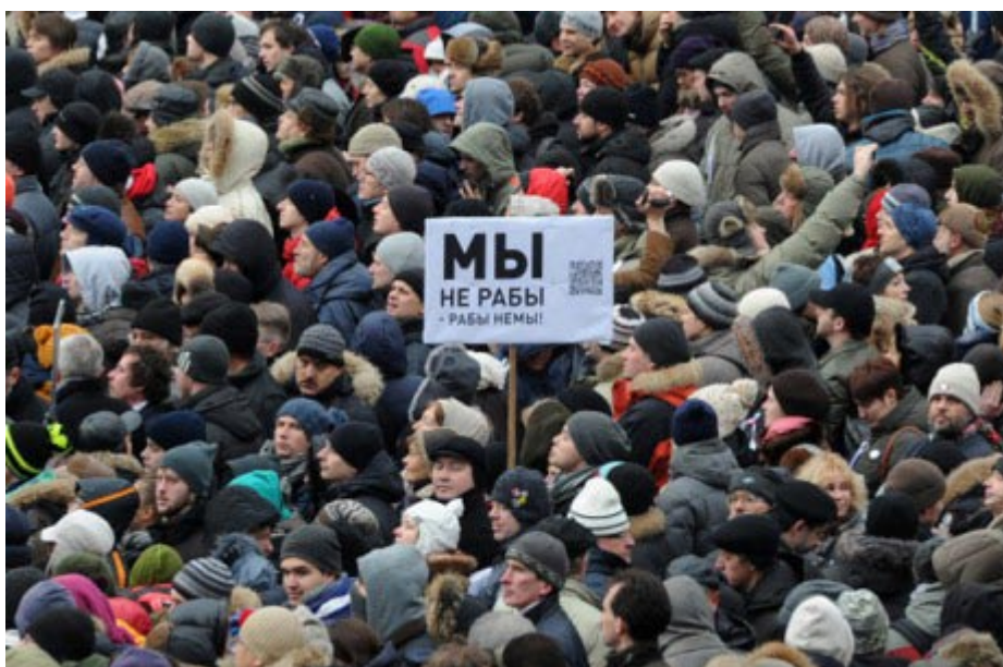
Biểu ngữ ghi rõ: "Chúng ta không phải là nô lệ - nô lệ câm"