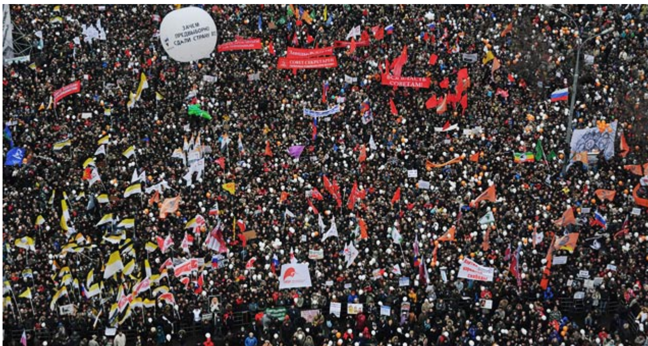
Cuộc biểu tình trên đại lộ Sakharov ngày 24.12.2011