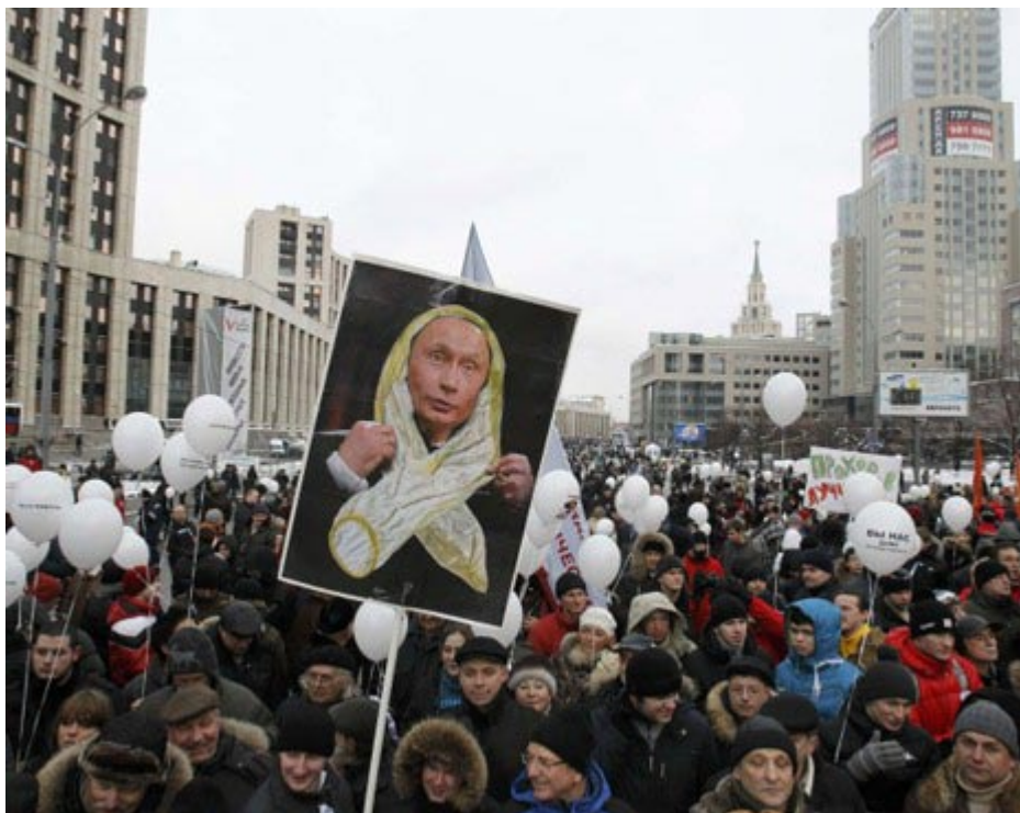
Chân dung ông Putin quàng cổ và đầu bằng một bao cao su to tướng.

Sau hai cuộc biểu tình lớn chưa từng thấy dưới thời Putin-Medvedev, nước Nga ngày nay bắt đầu một cuộc khủng hoảng chính trị sâu sắc. Cuộc khủng hoảng đó biểu lộ rõ trên mấy mặt: