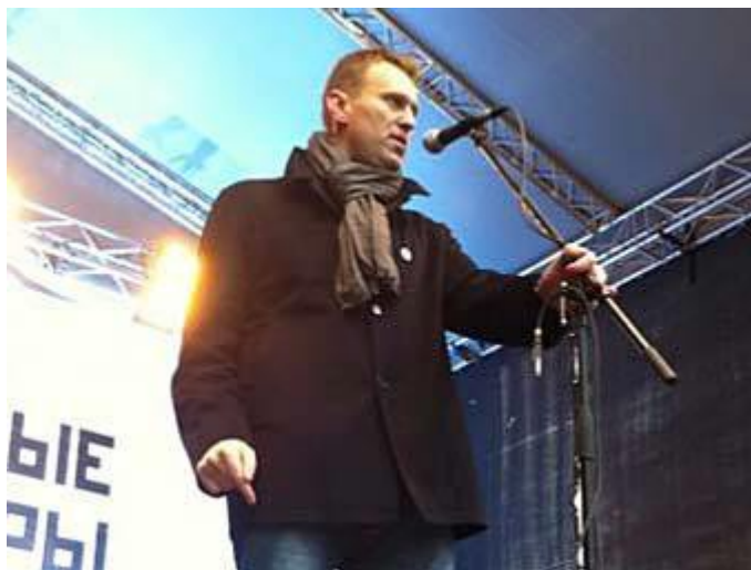
Navalny phát biểu trong cuộc biểu tình trên đại lộ Sakharov.

Hoạt động trong dịp bầu cử Quốc hội Nga năm 2011 : Navalny là người đầu tiên tuyên bố trên đài phát thanh “Finam FM” vào ngày 2.2.2011: đảng Nước Nga Thống nhất là “đảng của những kẻ bịp bợm và trộm cắp”. Luật sư Gorgadze nói rằng lời tuyên bố đó xúc phạm các đảng viên thường của đảng Nước Nga Thống nhất và ông sẽ kiện ra tòa. Để trả lời, Navalny liền mở cuộc điều tra dư luận trên blog của mình, đề nghị trả lời câu hỏi: “Đảng Nước Nga Thống nhất có phải là đảng của những kẻ bịp bợm và trộm cắp không?”. Trong số 39 467 người trả lời, có 96,6% đã trả lời “đúng thế!”. Theo yêu cầu của đài “Finam FM”, dân biểu Quốc hội Nga thuộc đảng Nước Nga Thống nhất Evgeni Fiodorov, chủ tịch ủy ban kinh tế, đã tham gia cuộc tranh luận để bác bỏ lời buộc tội đó. Cuối cùng, người điều khiển buổi tranh luận đề nghị bỏ phiếu-SMS: trong số 1354 người tham gia tranh luận thì 99% đồng ý với nhận định của Navalny. Ngày 5.12.2011, sau cuộc mít tinh trên đại lộ Chisty prudy để phản đối cuộc bầu cử gian lận, Alexei Navalny đã bị cảnh sát bắt giữ cùng với Ilya Yashin; tòa án phạt giam hai anh này trong 15 ngày, đến ngày 21.12, mới được thả ra. Anh đã từng tuyên bố sẽ ra ứng cử tổng thống.