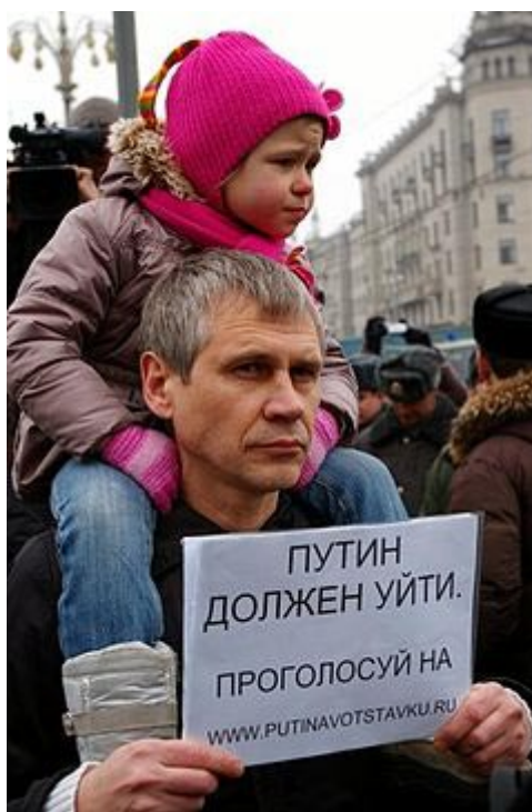
“Putin phải ra đi. Hãy bỏ phiếu trên mạng...”